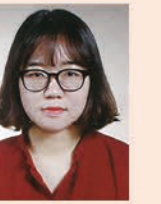
신연경 기자 경기신문

“수원문화재단의 ‘도도링크(島島Link)’ 사업은 코로나19로 어려운 때에 반기운 기회로 다가 왔습니다.”